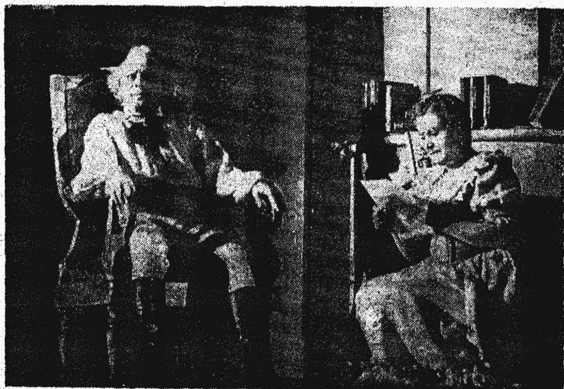
Сцена из спектакля «Суворочка».