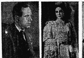
И. С. Козловский.

Но материальная сторона хотя и существенна, тем не менее не все в жизни решает. Тем более в жизни творческой. Вот и зарубежные гастроли выгодны, конечно, но реуется туда наши артисты еще и потому, что там они получают то, без чего их труд лишается смысла.