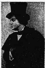
С. А. Лемешев.