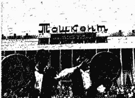
На снимке: встреча артистов Большого театра на аэродроме в Ташкенте.