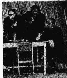
Графика на репетиции спектакля «Октябрь».