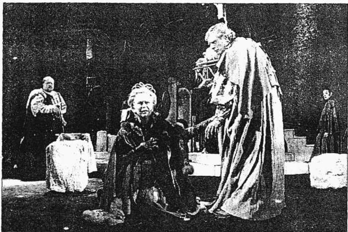
Вверху: сцена из спектакля "Чума на оба ваши дома". Внизу: сцена из спектакля "Акомпаниатор"

пишет Горин свои паравразы классических сюжетов? Ответить нетрудно — он, лишь отпавываясь от хрестоматийного произведения, неизменно интересуется умонастроением, проблемой дня сегодняшнего. Он весь — в нашем времени, о котором умеет говорить умно, ярко, но столько с юмором, сколько с печальной философской иронией.