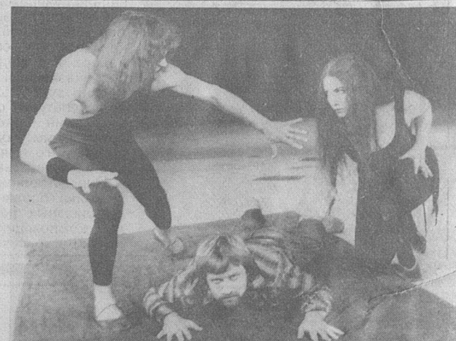
«Плаха». Сцена из спектакля.

В столице театр покажет чеховского «Иванова». К драматургии А. Чехова коллектив обратился впервые. Для работающих над