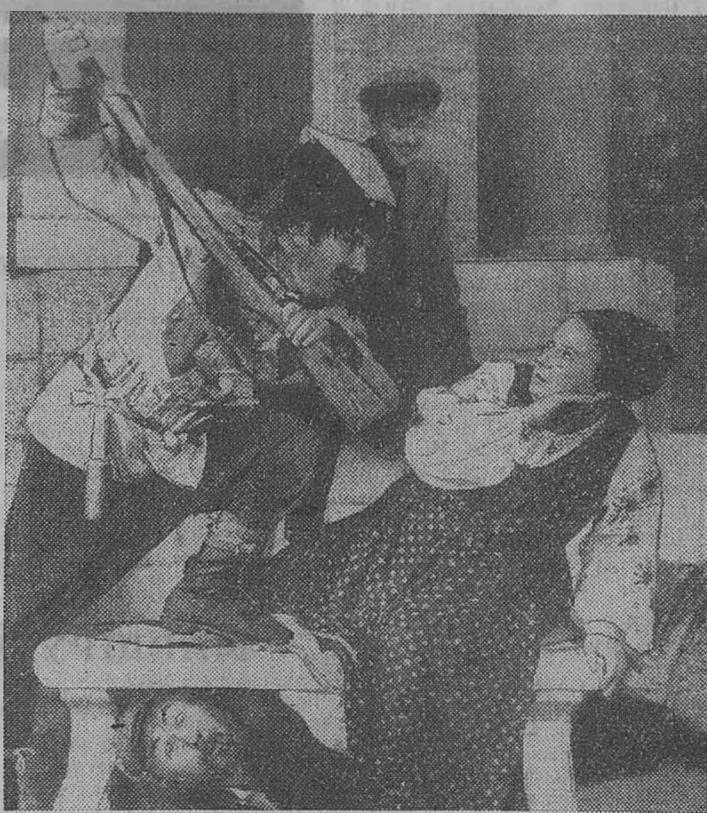
Сцена из спектакля «Свадьба в Малиновке».

вестного рассказа русского писателя Н. Лескова «Очарованный странник». Но все-таки моя сокровенная мечта, как режиссера, остается пока неисполненной. Хотелось бы осуществить спектакль высокого патристического звучания о нашем современнике, строителе нового, коммунистического общества. Было бы замечательно, если бы кто-нибудь из наших крымских писателей взял на себя огромный и благородный труд помочь театру создать пьесу о наших земляках. Сколько у нас замечательных людей, жизнь и дела которых могут и должны быть запечатлены в произведениях искусства и литературы. Вот тогда придет партия: «Детели литературы и искусства, работники культуры! Высоко не сите знамя партийности советского искусства, отдавайте все силы и способности воспитанию строителей коммунизма!» — нами будет выполнено еще более успешно. И я уверен, что тогда зрители будут спрашивать: «Нет ли у нового, коммунистического общества, ка?» Е. БОЙКО, режиссер театра.