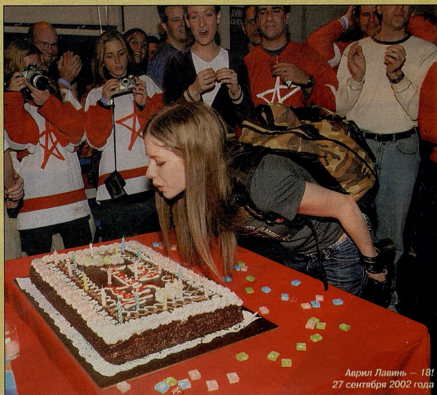
Аврил Лавинь — 18! 27 сентября 2002 года

Б райан Адамс, Селин Дион, Аланис Морисетт, Нелли Фуртадо и теперь — еще одно звездное имя, Аврил Лавинь . Все эти музыканты из Канады, регулярного поставщика исполнителей высокого класса на американский и всемирный рынок шоу-бизнеса. Новая звездочка Аврил юна — когда она столь успешно «выстрелила» своим дебютным синглом «Complicated», ей было 17 лет и она недавно прибыла из городка Напани с населением 5 тысяч человек. Этот сингл сразу же оказался на втором месте в престижном европейском чарте European Top 100 Single Chart и до сегодняшнего дня не опускался ниже пятого места. К концу 2002 года шум-