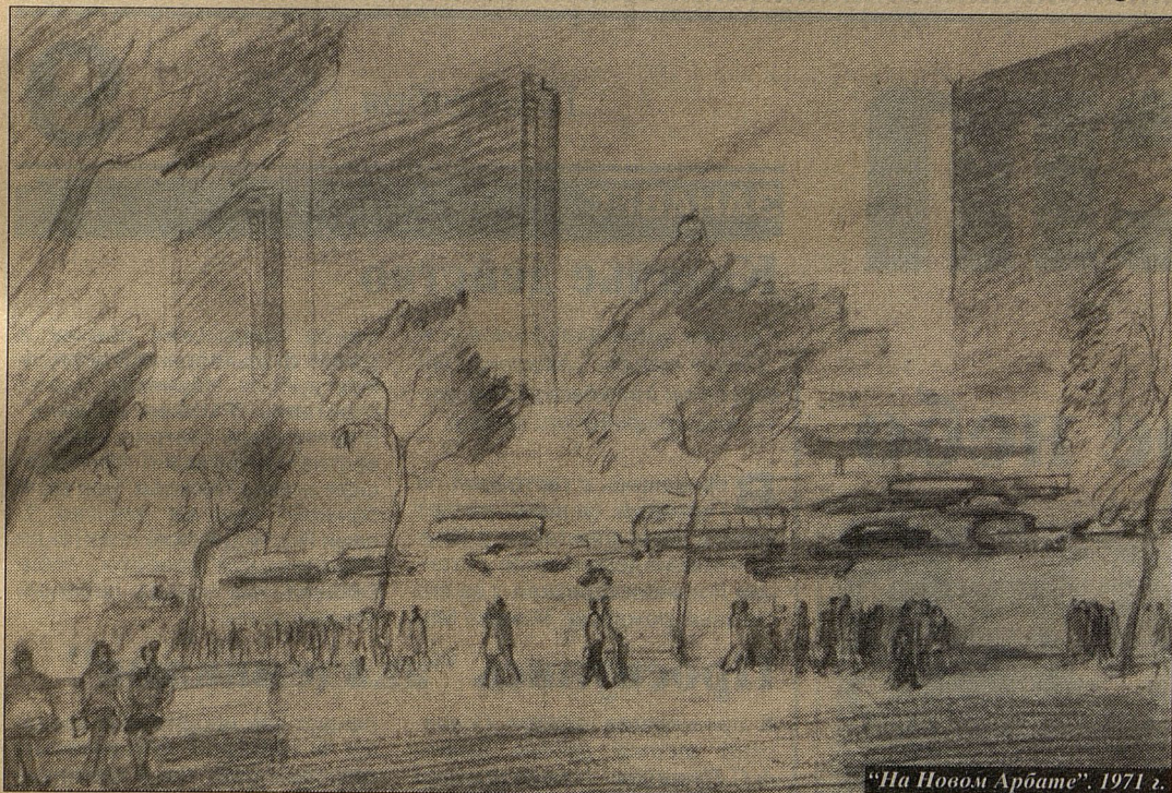
"На Новом Арбате". 1971 г.