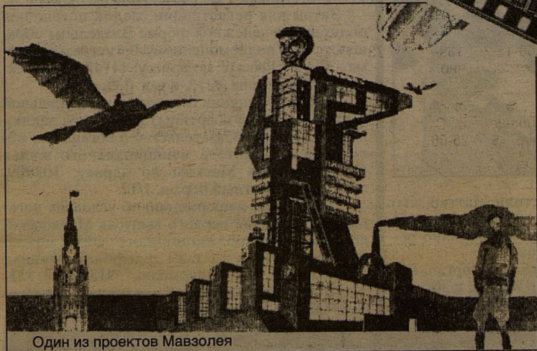
Один из проектов Мавзолея

- Фильм первый (единственный пилот которого уже снят) посвящен мавзолею. Не знаю почему, съемки целых ста фильмов начались с него, знаю только, что он - одно из культовых сооружений двадцатого века - достоин того, чтобы из него делали главного героя. Во-первых, он очень красивый, вряд ли кто-то (даже из тех, стоящих в свое время в длинной очереди, чтобы посмотреть на труп вождя пролетариата) видел, какой он красивый внутри. Во-вторых, это символ коммунистической религии, занимавшей