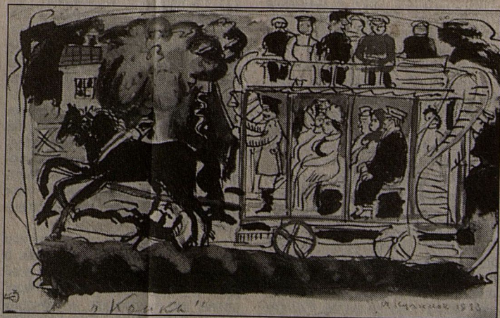
“Конка”. 1923 г.

В Малоярославце трепетно относятся к памяти художника. К 100-летию и 110-летию Афанасия Ефремовича там прошли его персональные выставки. Примечательно, что по замыслу потомков Куликова, семьи Бакатиных, благодаря которым была издана книга, средства от ее продажи будут направлены Картинной галерее Малоярославца.