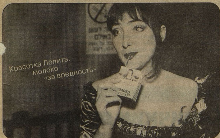
Красотка Лолита: молоко «за вредность»