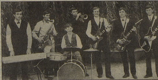
■ В 16 лет Игорь Крутой (слева) уже играл на танцах в родном Гайвороне

— И баян преподавал, и сольфеджио. Некоторое время назад со мной произошел интересный случай. На правительственном приеме в честь Дня милиции ко мне подошел высокопостав-