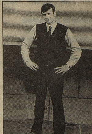
■ В годы учебы в музыкальном училище

— Такое случалось, и не только в молодости — а как может быть иначе во времена, когда всю страну лихорадит? Но я научился такие периоды переживать. Когда-то случалось, что в кармане оставалось 40 копеек. Но я все равно брал такси и внимательно следил за счетчиком. Когда доходило до 40 копеек, я останавливал машину и говорил водителю: «Я приехал!»