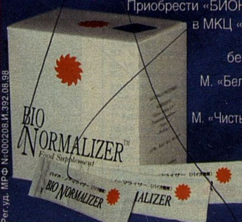
Рег.уд. МР-Ф. N-00208. И. 392.08.98

М. «Комсомольская» Тел.: 755-8939, 262-3855, 784-6480.