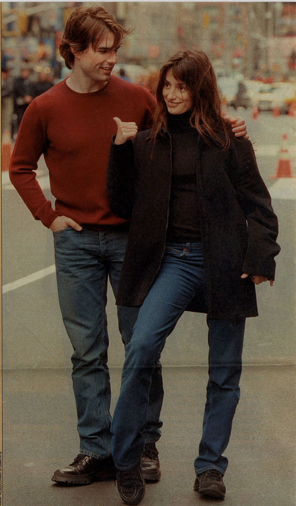
Знакомые утверждают, что Том — как пластилин в руках Пенелопы

P.S. Оставленная жена Тома — Николь Кидман — до сих пор оплакивает свой погибший брак. В какой-то момент появилось сообщение о том, что у нее начинается роман с Расселлом Кроу — он приезжал к ней на Фиджи. Позже выяснилось, что приезжал он не один, а с красоткой Петой Уилсон (все трое — австралийцы и, приехав в Голливуд, стали держаться вместе). Больше никаких мужских имен рядом с именем Николь в последнее время не появлялось.