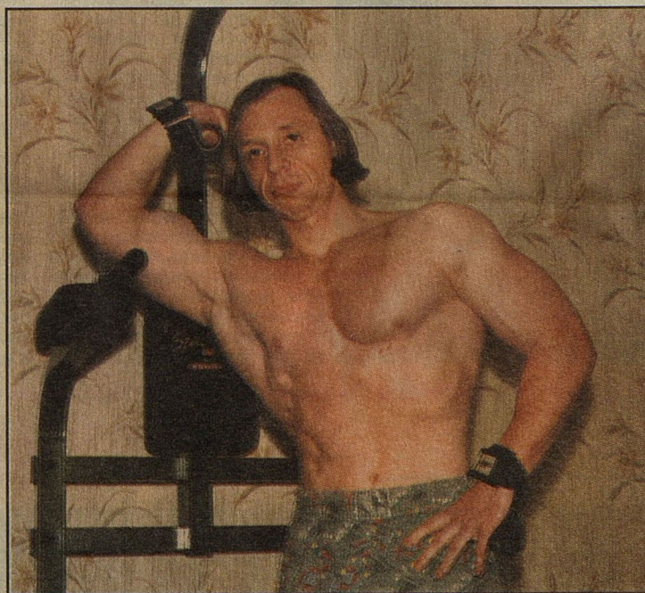
Ему есть что рассказать мужчинам... и показать женщинам