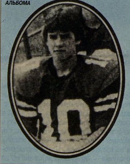
ФОТО ИЗ ШКОЛЬНОГО АЛЬБОМА