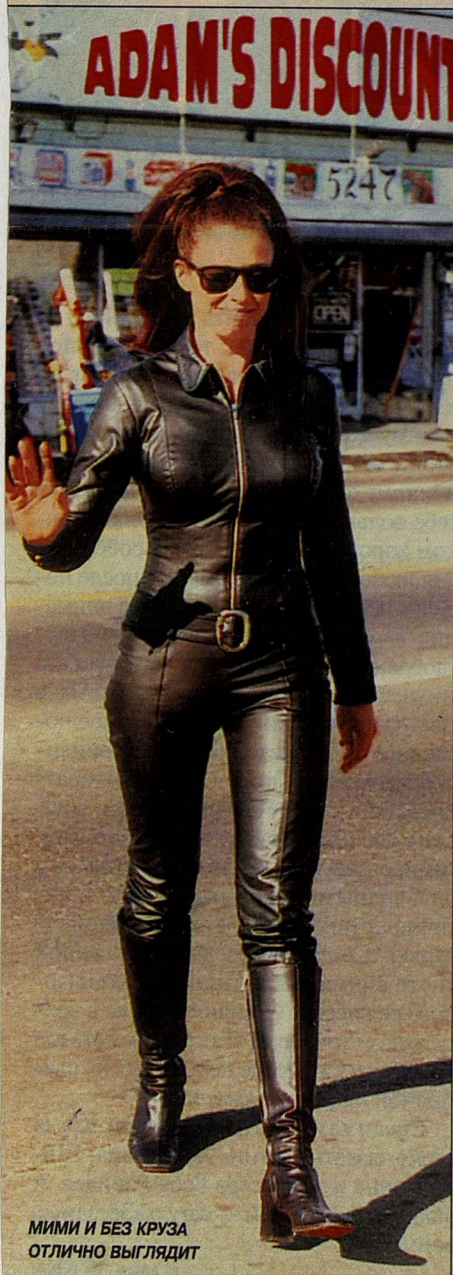
МИМИ И БЕЗ КРУЗА ОТЛИЧНО ВЫГЛЯДИТ

Они поженились в 1987 году. После свадьбы Том признался журналистам: «Мими — лучший подарок в моей жизни. Она полностью соответствует моему идеалу. Она способна дать мне то, что всегда было для меня на почетном месте: очаг, уют, детский смех, семейные пикники...» Но время шло... а животик жены Круза не менялся в размере. Пресса всю «допрашивала» бывших любовниц актера о его мужских возможностях. Среди «бывших» испытательниц его мужественности были: певица Шер, актрисы Хитер Локлир, Ребекка Де Морней и Мелисса Гилберт. Сумерки над «достоинством» Круза сгущались. Мими и Том решаются пройти медицинское обследование, по-