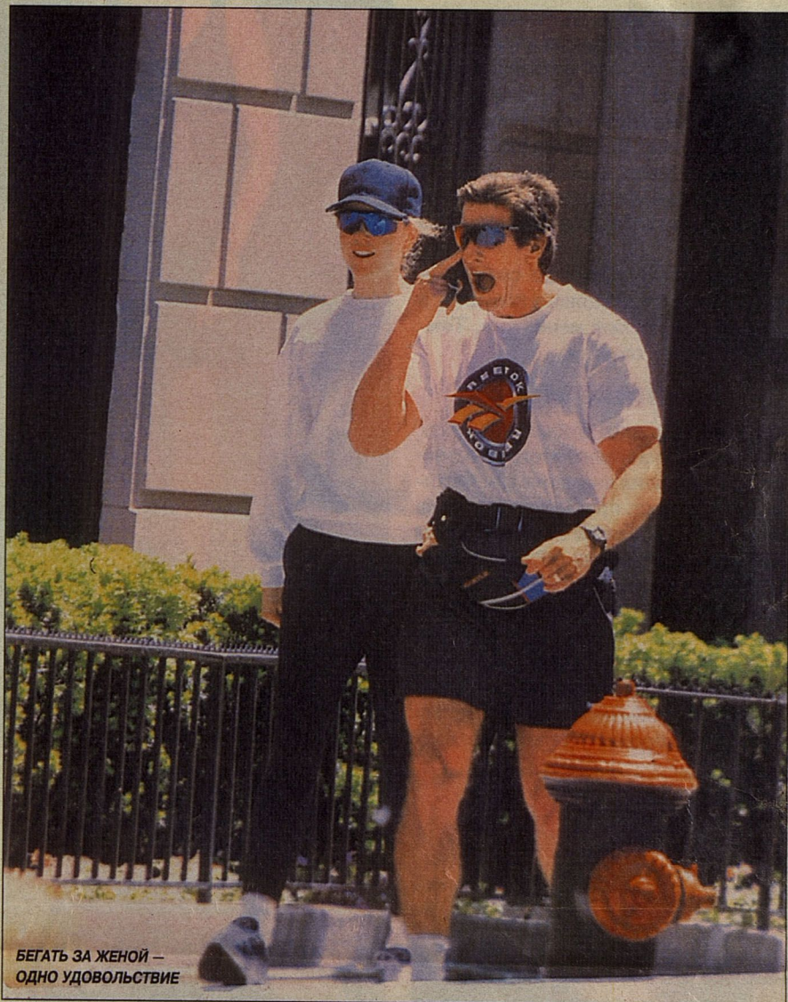
БЕГАТЬ ЗА ЖЕНОЙ — ОДНО УДОВОЛЬСТВИЕ

Всем известно, что Том Круз повсюду, даже на съемках, ходит с... толковым словарем, все время подглядывает в него, вызывая всеобщий смех.