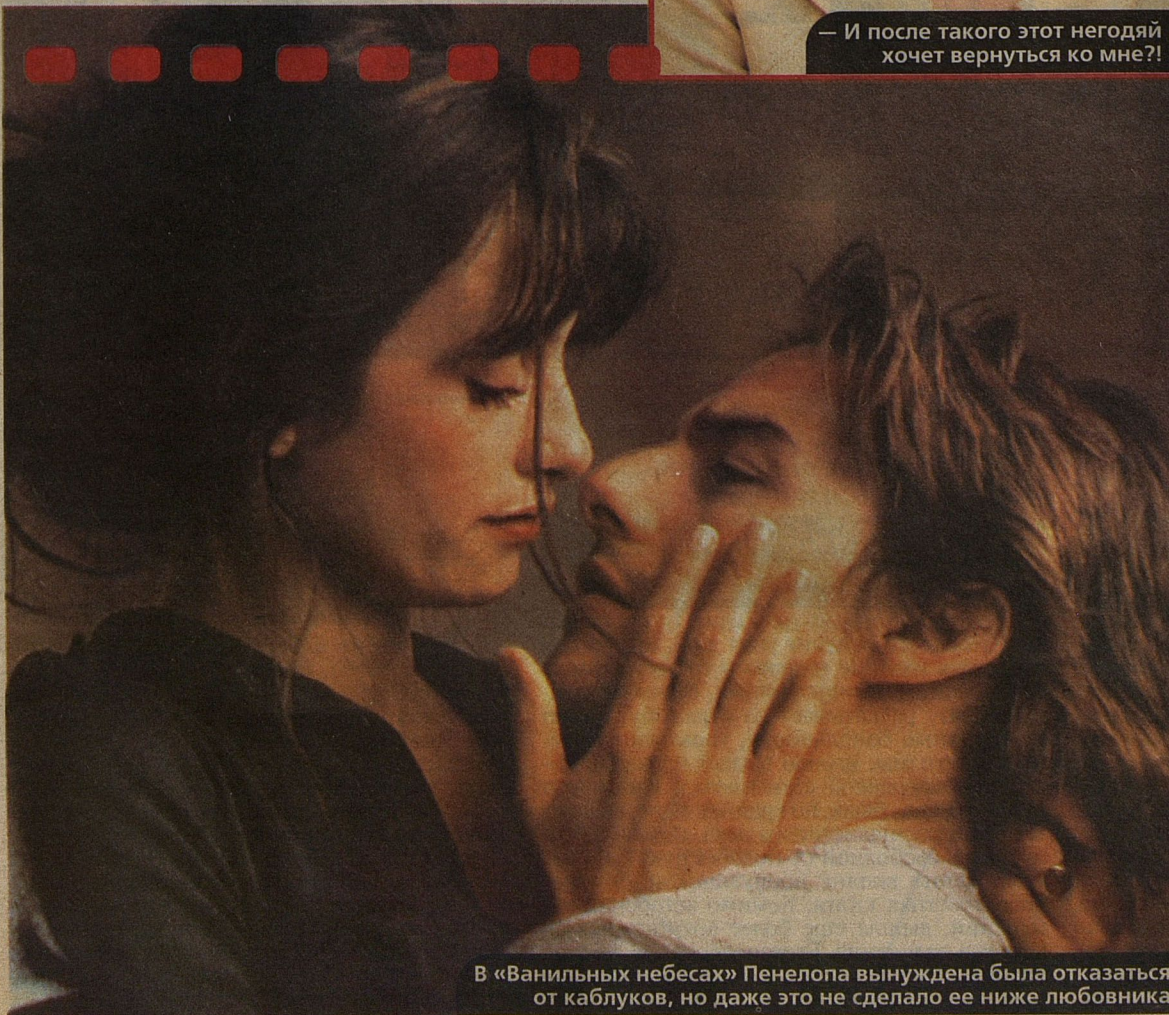
В «Ванильных небесах» Пенелопа вынуждена была отказаться от каблучков, но даже это не сделало ее ниже любовника

— И после такого этот негодяй хочет вернуться ко мне?!