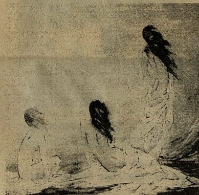
Т. Щербакова. Подношение облака.

Работы Морозова пользуются популярностью не только в родном отечестве. Множество их разбросано по частным коллекциям "зарубежныи".