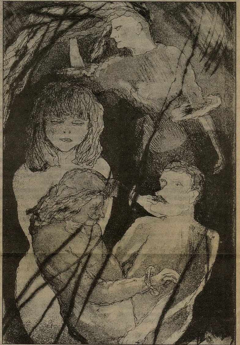
Офорт «Сплин» к изданию «Шарль Бодлер. Избранное». 1992 г.

пивницкие. Именно благодаря им в Третьяковской галерее на Крымском валу в эти дни проходит мемориальная выставка. На ней представлена живопись из коллекции семьи художника, а также из фондов галереи. Праздник общения с мэтром, который был начат в Мансарде, продолжается.