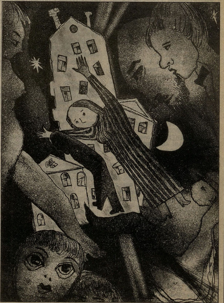
Офорт «Вечерний сумерки» к изданию «Шарль Бодлер. Избранное». 1992 г.