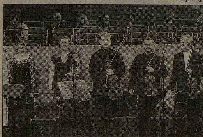
Мастро и солисты "Кремераты Балтики"

Литовские композиторы Видомунтас Бартолис и Освальдас Балаускас подарили целый ряд сочинений. Короче говоря, как вы видите из перечня авторов (я еще, наверное, кого-нибудь забыл), стараемся слушать современную музыку, в первую очередь, тем композиторами, которые до сих пор живут в России, Балтике и странах бывшего Советского Союза. Молодым музыкантам, которые исполняют современную музыку, дается возможность понять, как она создается, почувствовать ожидания композитора от первых исполнителей. Я всегда считал обязанностью идти, как раньше было принято говорить, в ногу со временем. На мой взгляд, одна из задач музыканта — играть сочинения живущих композиторов, то есть содействовать тому, чтобы в развитии музыки жила свежесть. Я перенял эти качества