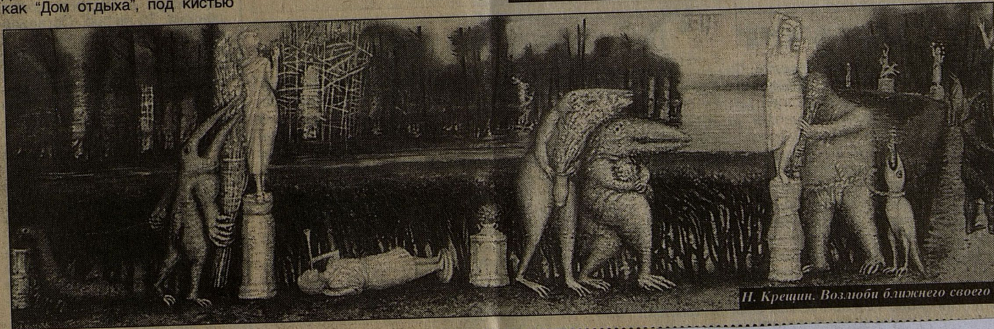
Н. Кращин. Возлюби ближнего своего