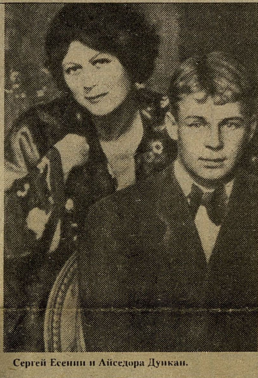
Сергей Есенин и Айседора Дункан.