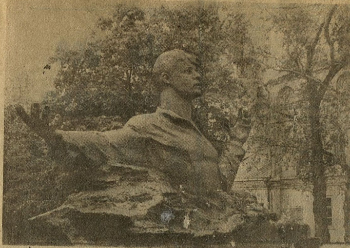
* Памятник С. Есенину в Рязани.