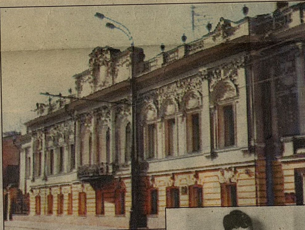
■ В этом доме на Пречистенке Есенин и Дункан прожили два года