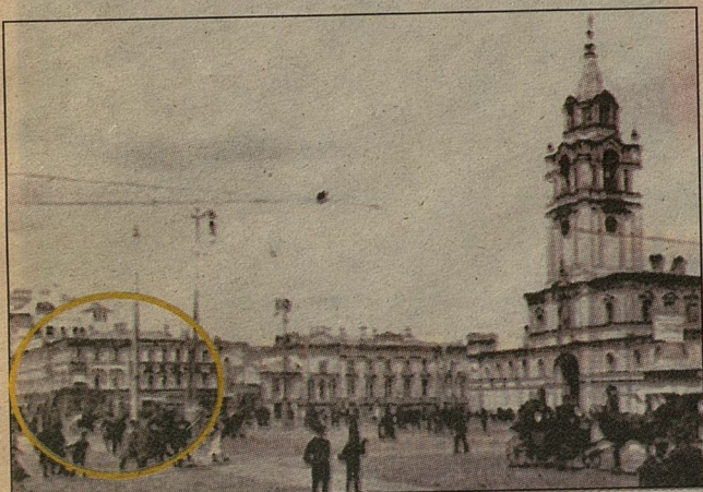
■ Товарищество «Культура» на Малой Дмитровке. Фото конца 20-х годов

— Поэзию Есенина впитываешь в себя с детства, но в каждый период жизни понимаешь ее по-разному. Сегодня мое любимое стихотворение Есенина — о матери: «Ты жила еще, моя старушка...» Но я всегда любил его стихи про русскую природу. Зимой собираюсь привезти детей в Россию. Но не в Москву, где они уже были, а в Сибирь — посмотреть, что такое настоящий снег, про который они знают только по стихам Есенина.