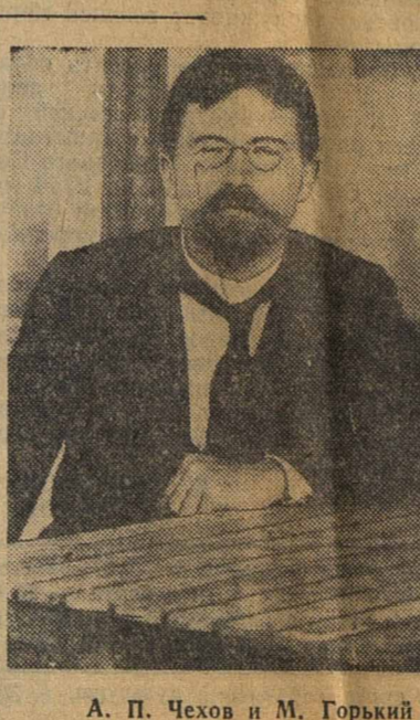
А. П. Чехов и М. Горький в Ялте.

Сказать правду о неприглядной действительности царской России А. П. Чехов считал своим общественным долгом. Сознание этого долга побуждало его совершить поездку на остров Сахалин, где томился десятками тысяч каторжников. Известный в то время издатель Суворин пытался отговорить Чехова от этой трудной и опасной поездки. Но Антон Павлович был непреклонен и возразил с необыкновенной силой убеждения. «Сахалин, — писал он, — это мес-