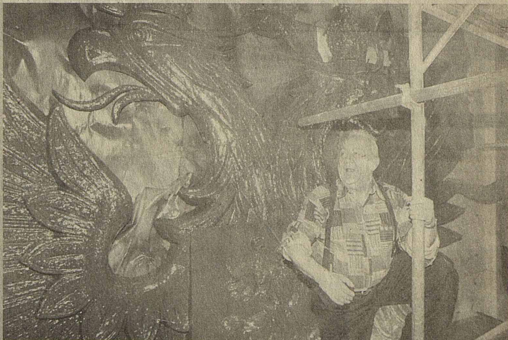
Церетели рядом с очередной своей работой — двухглавым орлом, который сейчас установлен на фронтоме Дома правительства.