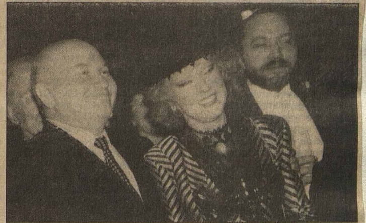
Юрий Лужков выкроил время для беседы с Людмилой Гурченко и ее мужем

рели 240 свечей — именно столько лет существует Российская академия художеств. Собравшиеся в центре зала академики дружно их задули, после чего атмосфера вечера утратила всякую официальность. Все смешалось: Махмуд Эсамбаев целовался с Борисом Мессерером, Зураб Церетели — с Ильей Глазуновым, Юрий Башмет — с Иосифом Кобзоном, Людмила Гурченко — с Юрием Лужковым. Новоиспеченный президент академии охотно позировал фотографам. Некоторые из присутствующих, правда, заметили явную избирательность: Зураб Церетели позвонил сфотогра-