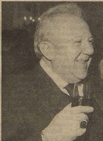
Добро — вечное начало его творчества

Андрей ДЕМУТ'ЕВ, лауреат Государственной премии СССР