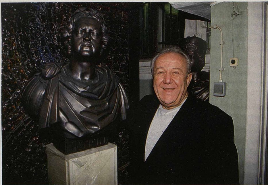
Его постоянно окружают президенты и цари

ство во Франции. По преданию, половину этого наследства Церетели передал государству. Оставшаяся половина составила первоначальный капитал для его художественного бизнеса.