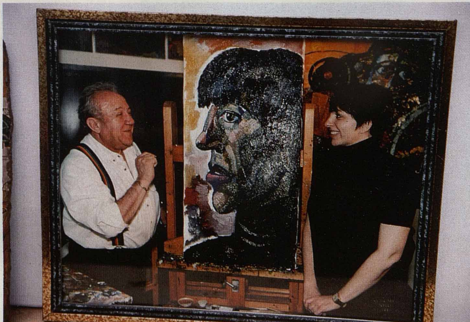
Портрет Лайзы Минелли — актрисе в подарок

Яркие натюрморты, пестрые сочные букеты. Рисует стремительно и очень хорошо. В последние годы его прогресс как живописца очевиден, в этой области он явно сейчас достиг пика. Но эту сторону своей деятельности Церетели упорно держит в тени — он, академик Академии художеств, не имел ни одной персональной выставки в Москве. Он редко дарит картины, разве что королям и президентам, и практически никогда живопись не продает. Более того, он скупает собственные ранние работы — дал задание тбилиским антикварам отыскать свой дипломный холст.