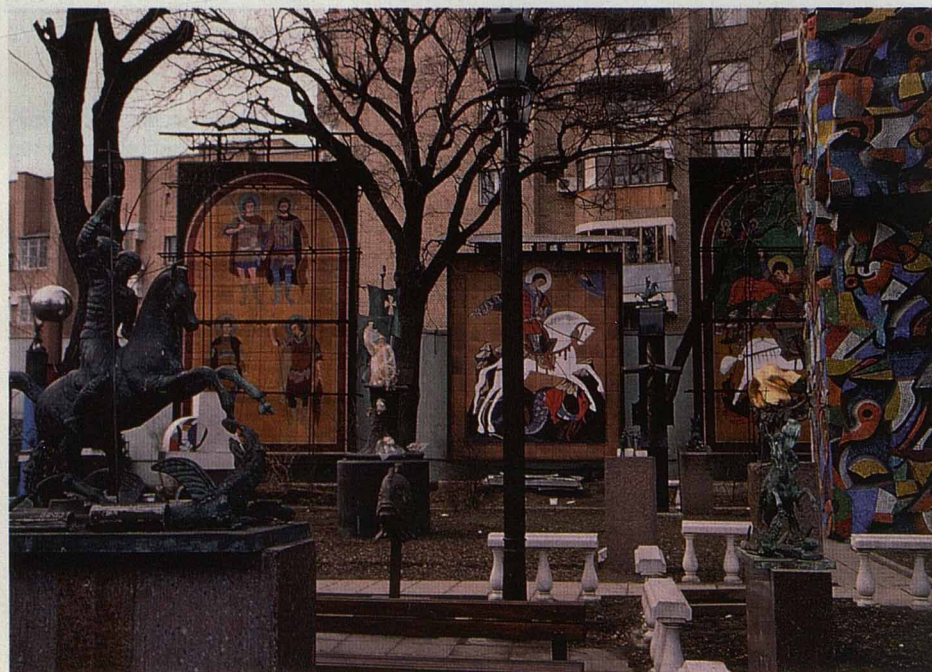
Внутренний двор усадьбы напоминает сад Черномора

К красивым вещам он действительно равнодушен. Ника на Поклонной горе была скопирована с подсвечника — бронзового ампириного, начала XIX века, канделябра. Кто же виноват, что в процессе двадцатикратного увеличения от изысканного русского ампира ничего не осталось?! Вообще, все его монументы, если приглядеться, напоминают гигантских размеров письменные приборы.