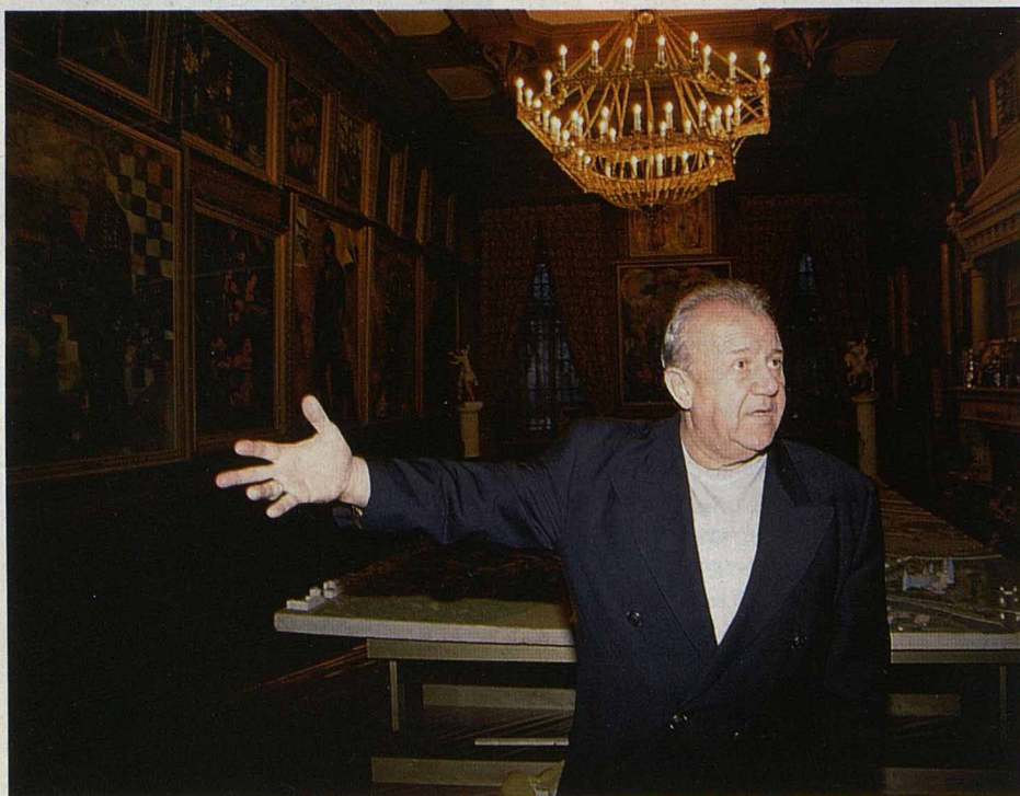
О роскошном доме Зураба Константиновича слагают легенды

У Церетели была возможность путешествовать: в Париже он был представлен Марку Шагалу — они мило поговорили о погоде и природе; сохранилась магнитофонная запись этой беседы. А с Пикассо ему удалось даже поработать. Из общения с великими Зураб Константинович вынес один бесценный урок: художнику подвластны любые стихии. И он,