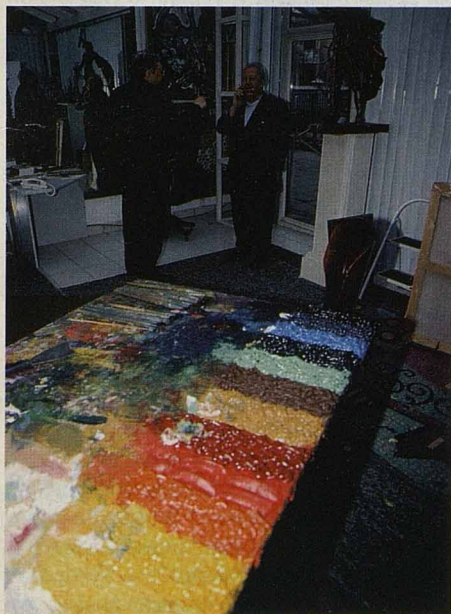
Знаменитая палитра маэстро

Его рабочая палитра, лежащая в мастерской, описана абсолютно во всех статьях и книгах: размером с обеденный стол, с килограммами выдавленных красок. Такое впечатление, что по утрам ее специально обновляют, вытирают пыль и выдавливают свежие тюбики.