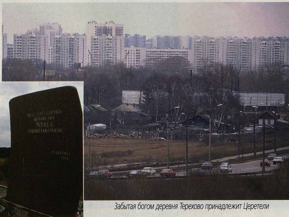
Забятая богом деревня Терехово принадлежит Церетели

Жители деревни не могут ни приватизировать жилье, ни продать свои дома и земельные участки, ни поменять. Строить новые дома на этой земле тоже бессмысленно.