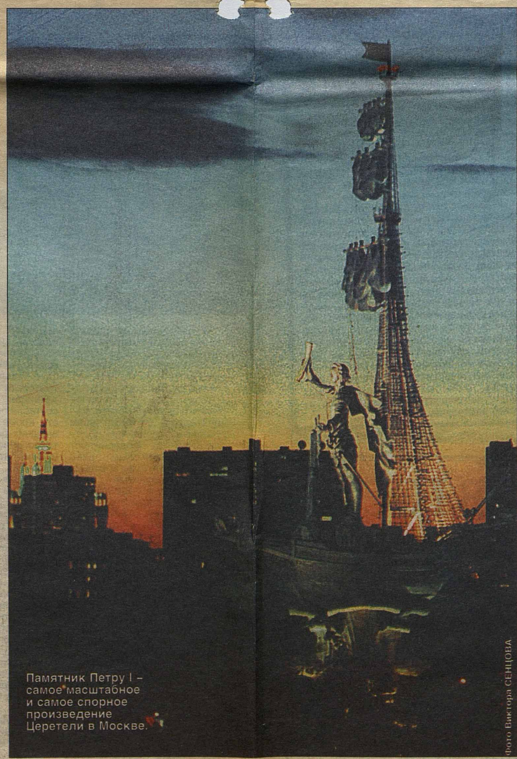
Памятник Петру I – самое масштабное и самое спорное произведение Церетели в Москве.

- Ну как же. Я стюардесса из Грузии. После открытия памятника «Трагедия народов» я вас обслуживала в самолете. Вы мне подарили колбасу и крест. Я до сих пор их ношу, и, не поверите, ваши подарки приносят мне счастье. Мой сын пошел по вашему пути, оканчивает художественный факультет. Можно ему попрактиковаться в вашей академии?