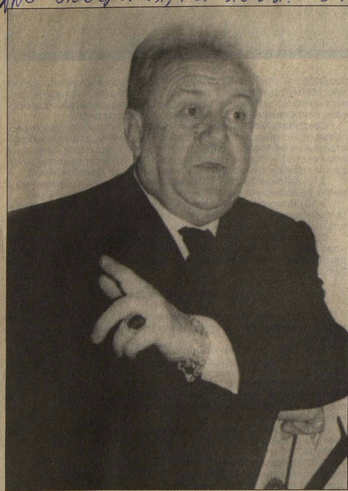
В Галерее искусств (ул. Пречистенка, д. 19), входящей в комплекс зданий Российской академии художеств (РАХ), первого ноября открылась персональная выставка произведений крупнейшего скульптора-монументалиста и живописца современности, президента РАХ Зураба Константиновича ЦЕРЕТЕЛИ. Когда я спросил у великого мастера: «Неужели на нынешней выставке в Галерее искусств собрана целая тысяча ваших работ?», он, мягко улыбаясь, ответил: «Тысяча, но не единственная»

Да, в пятнадцати залах Галереи искусств на общей экспозиционной площади в 10 тысяч квадратных метров, выставлена именно тысяча произведений мастера, многие из которых - впервые. Здесь представлены станковая скульптура и портрет, натюрморт и графика, эмалевые панно и миниатюры, мозаика и дизайнерские работы. Все, что сделано, - за горизонтом человеческого понимания. О неиссякаемой работоспособности Церетели ходят легенды: спит он максимум четыре-пять часов, рисует даже на заседаниях президиума РАХ. А из недавней десятидневной поездки по русскому Северу привез более тридцати графических листов, созданных им в промежутках между встречами, переговорами, беседами и... застольями.