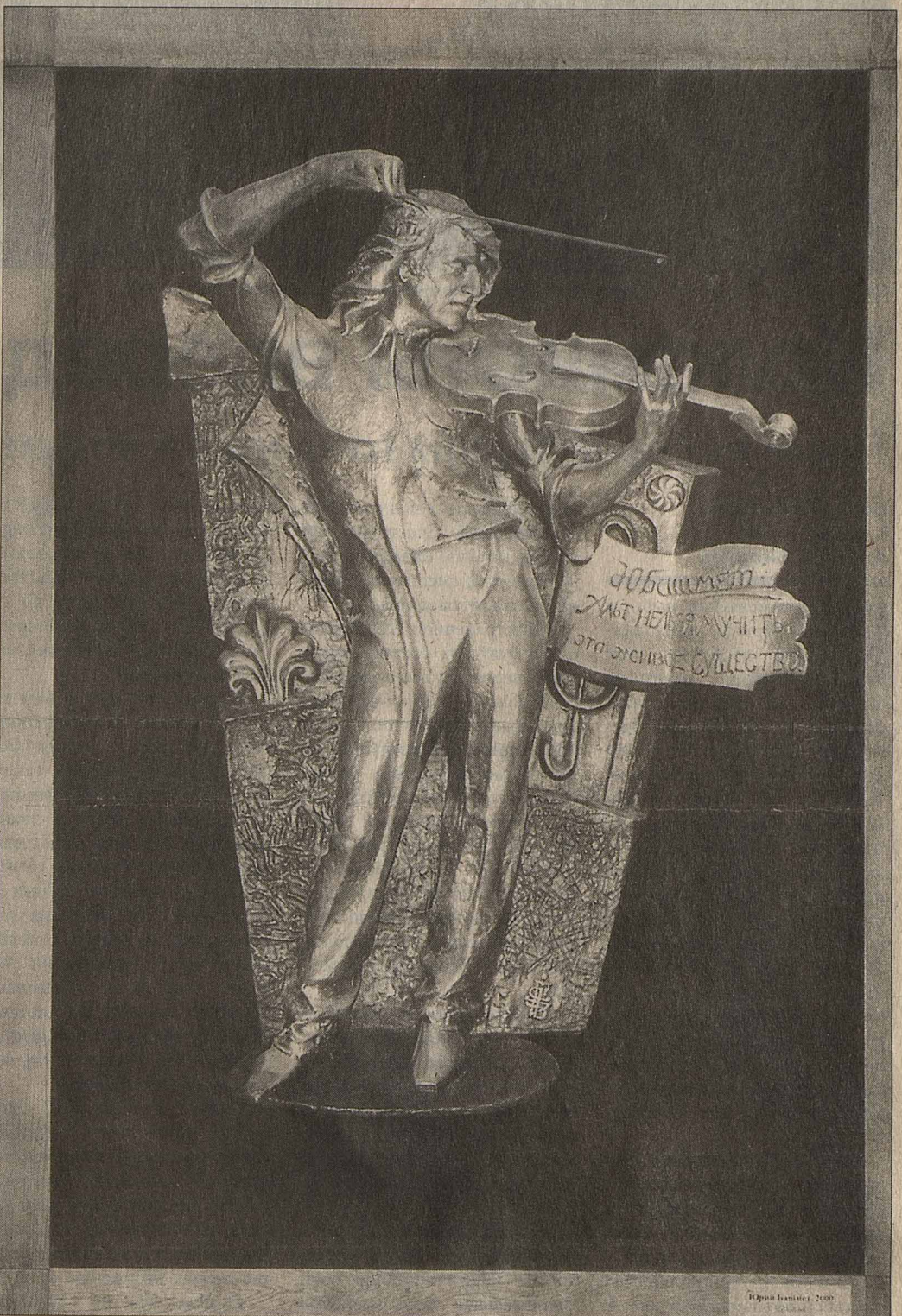
Церетели благоволил к музыкантам. Барельеф Юрия Башмета.

родийность. Но в том-то все и дело, что в отличие от постмодернистов Церетели все делает всерьез и очень искренне. В нем нет подбострастного подхалимажа – он искренне любит Лужкова. В нем нет иронии – он искренне налепливает одну форму на другую, совершенно не соотносясь с пластикой. У него нет фиги в кармане – он искренне дарит что имеет. Оттого, может быть, и скучно. ■