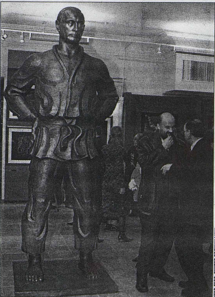
«Академический» Путин выше настоящего вдвое.

— Числом талантов уникален, в энергии феноменален. Он живописец, скульптор, зодчий, дизайнер, график, керамист, акварелист и офортист, и портретист, и пейзажист, чудеснейший натюрмортист, великий монументалист.