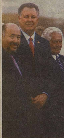
РИСУНОК ТАМРА ЦУРАБЕ

ДАР СВЯТОГО НАРОДА ЦИМИР ПУТИН СИТЕ WILL BE A HOME OR THE MONUMENT THE STRUGGLE AGAINST WORLD TERRORISM ARTIST ZURAB CERETELI