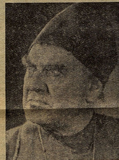
«Старик». Старик.