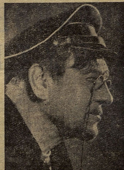
«Оптимистическая трагедия». Вожак.