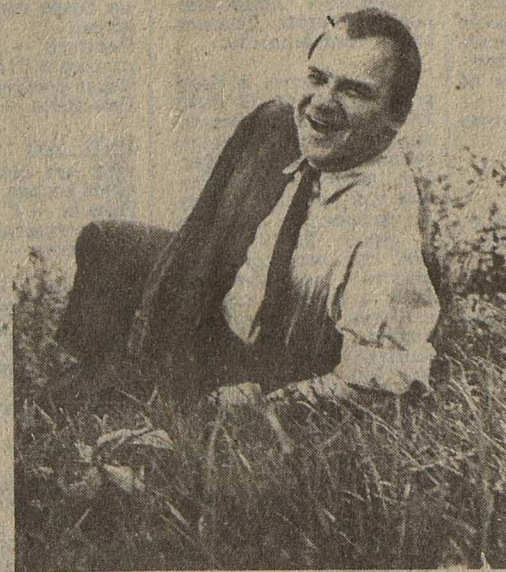
Руза. Лето 1959.