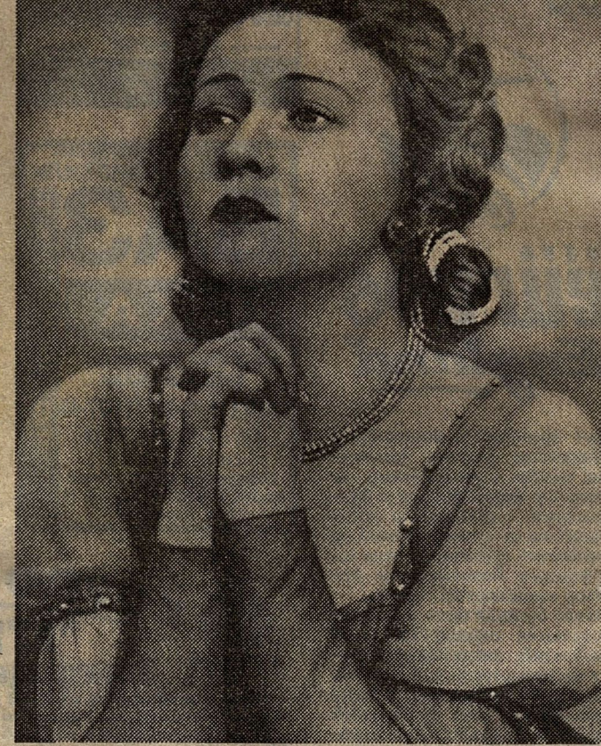
Джульетты лучше чем она - не было.

- Ну вот самое простое: вхожу в лифт и, если там есть люди, говорю: "Здравствуйте". И ни один человек мне не отвечает. Редко кто кивнет головой... Или в театре кому-то что-то надо сказать, он просто открывает дверь и говорит свое. Но почему же ты не спросишь, можно ли войти?