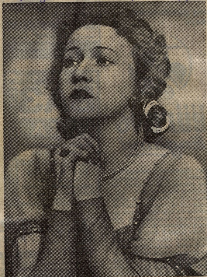
Джульетты лучше чем она - не было.

- Очень трудные. Революция, холод, голод... Но воспитывали-то нас прежние люди. У нас в балетной школе были классные дамы с хорошими манерами, со знанием многих языков. Мы лизали, конечно, как все