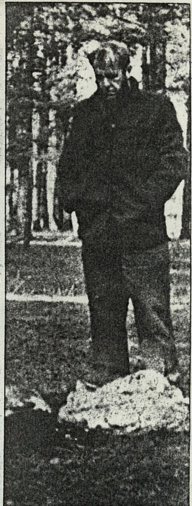
Чувства к первой жене у Солженицына сгорели, как этот костер

После чего задает ему в мыслях один и тот же вопрос: «Придешь ли ты ко мне на похороны, Санечка?»