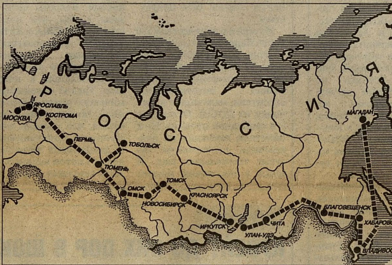
Путешествие по Родине: карта долгого возвращения.

Около двух месяцев Александр Солженицын ехал из Владивостока в Москву, посетив за это время почти все крупные города по Транссибирской магистрали. Останавливался в них на несколько дней, работал по 14 часов в сутки. «Я встречался поодиночке, с группами по 3–5 человек, с группами в 30–50 человек, с аудиториями в полторы тысячи и больше, — заявил писатель на Ярославском вокзале в Москве. — Я всех их сегодня благодарю за теплую, горячую встречу и за все бесчисленные добрые слова, которые я выслушал от них». И хотя по приезде в Москву Александр Солженицын уже несколько раз выступил перед телекамерами, рассказав о некоторых итогах своего путешествия, есть смысл — в ожидании газетных публикаций — вернуться к его непосредственным дорожным впечатлениям, разговорам в пути.