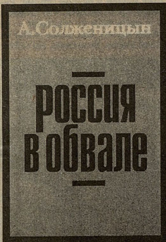
Александр Солженицын. Россия в обвале. — М.: Русский путь, 1998, 208 с.

Б ЫЛО — «из-под глыб», стало — «из-под развалин». «Нам всем думать надо лишь, как выбраться из-под развалин». Глыбы массивны, тяжелы, давят; развалины хаотичны, бессодержательны, как дурная бесконечность. Все ценное не создается без костяка и упора, ему нужен строительный остов. Глыбу можно отвалить, из глыбы можно вытесать хотя бы каменную бабу. Из-под развалов выбираются реже, на руинах вырастет трава забвения. В самом деле, «скрытая сокрушенная действительность, а объяснения к ней — риторны да приторны». Отсюда задача: дать объяснение не риторическое, не приторное, а существенное, если до конца и не отвечающее на растерянность и боль многочисленных вопрошателей, то хотя бы учитывающее ловушки времени.