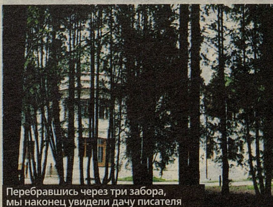
Перебравшись через три забора, мы наконец увидели дачу писателя

Александр Солженицын живет на выделенной ему государством даче в Троице-Лыково, на северо-западе Москвы. Место, хоть и в черте города, на редкость живописное: за домом — обрывистый, поросший березами, елями и соснами спуск к берегу Москвы-реки. Напротив — Серебряный бор. В тихую и ясную погоду пейзаж умиротворяет. Зеленый забор, окружающий дачу, спускается к самой воде. На запертых железных воротах — предостережение: «Стоять! Проход запрещен! Режимная зона!» Вдобавок по верху забора протянута колючая проволока.