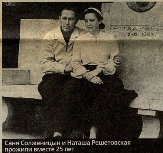
Саня Солженицын и Наташа Решетовская прожили вместе 25 лет

— После выхода «Ивана Денисовича» в «Новом мире» Солженицын стал очень популярен, каждая женщина охотно раскрывала ему свои объятия. А он был человеком творческим, увлекающимся... Причем изменял мне почему-то всегда с математичками. Но я на это закрывала глаза.