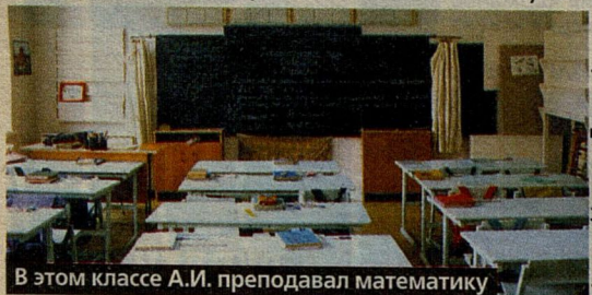
В этом классе А.И. преподавал математику