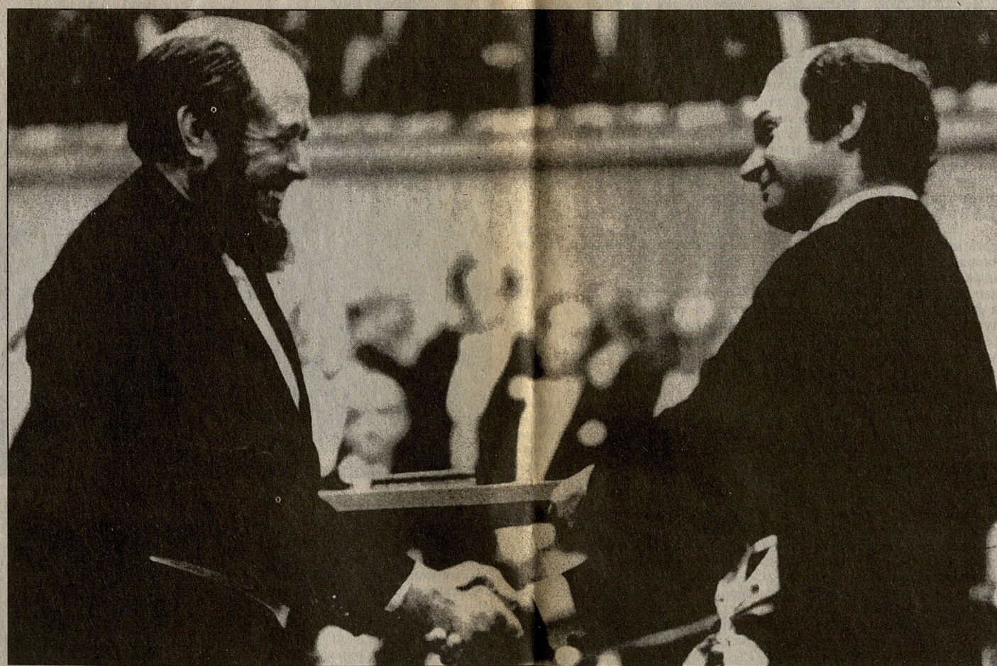
Александр Солженицын получает Нобелевскую премию.

(Окончание. Начало на стр. 9) Все иначе описал сам Твардовский: «Вообще я чувствовал себя так, будто зря туда попал, что я там чужой человек. Видно, так же себя чувствовал и Шолохов. И несмотря на нашу недружбу в последние годы, мне там самым близким оказался он. Я не надеялся, что встречу тут одобрение у слушателей... Их гробовое молчание и безучастные, равнодушные глаза предвещали мне недоброе. Все же с первых же строк чтения я увидел, что есть тут один человек, который не равнодушен к этому. С чем-то он мог быть и не согласен, но слушал всей душой, и я увидел, что написал поэму не зря. Более того, в этом зале было никого и не было кроме нас двоих — один читает, другой слушает. Теперь я видел только Шолохова...»