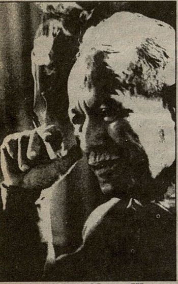
Михаил Шолохов.

Что же было на самом деле? На следующий день в Вешки ушла телеграмма: «Глубокоуважаемый Михаил Александрович! Я очень сожалею, что вся обстановка встречи 17 декабря, совершенно для меня необычная, и то обстоятельство, что как раз перед Вами я был представлен Никите Сергеевичу, — помешали мне выразить Вам тогда мое неизменное чувство, как высоко я ценю автора бессмертного «Тихого Дона». От души хочется пожелать Вам успеш-