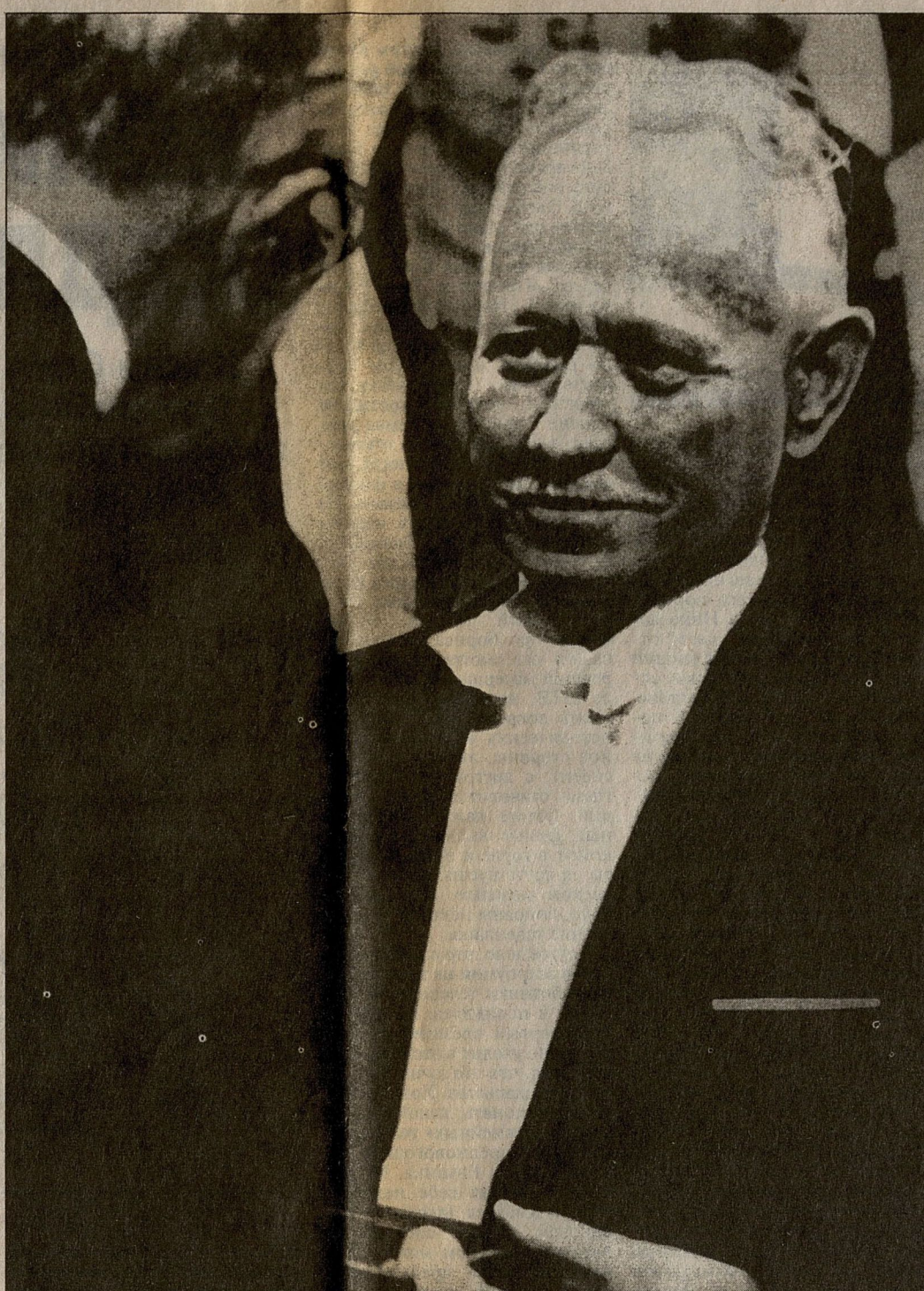
Михаил Шолохов получает Нобелевскую премию.