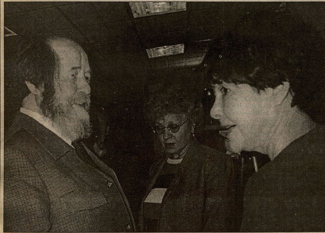
Александр Солженицын и Белла Ахмадулина.