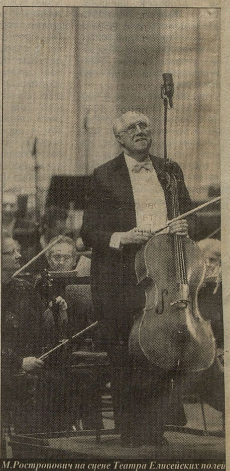
М. Ростропович на сцене Театра Елисейских полей

атр. Последний раз мой спектакль был поставлен в 1972 году. Так что посл 23 лет я вновь пришел в Большой театр, с "Хованщиной" - оперой, о которой мечтаю, но к которой все не мог подступить: ведь это очень большая ответствен-