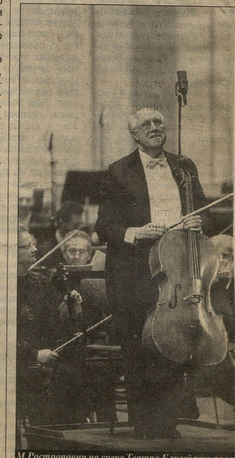
М.Ростропович на сцене Театра Елисейских полей

атр. Последний раз мой спектакль был поставлен в 1972 году. Так что посл- 23 лет я вновь пришел в Большой театр, с "Хованщиной" — оперой, о которой ме- тал, но к которой все не мог подступит- ся: ведь это очень большая ответствен-