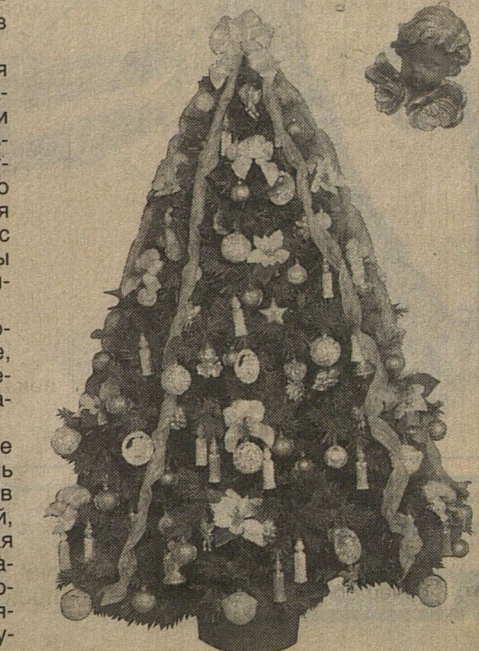
По сообщениям корреспондентов "Культуры" и ИТАР — ТАСС

Ростропович громко, бурно смеется. Да так заразительно, открыто, искрен- не, как может смеяться один лишь он. ПАРИЖ