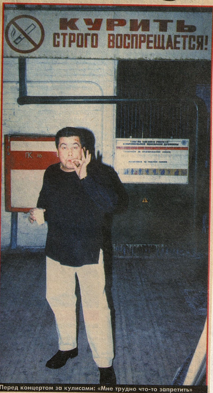
Перед концертом за кулисами: «Мне трудно что-то запретить»