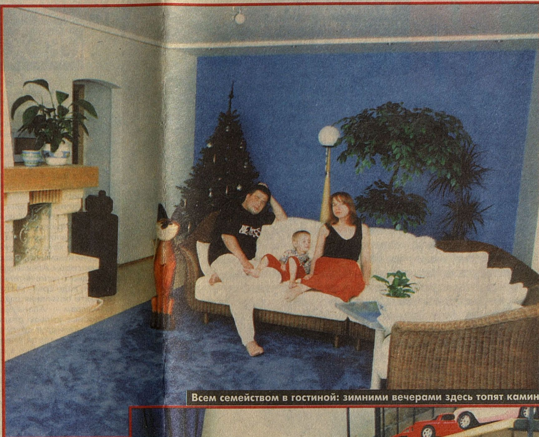
Всем семейством в гостиной: зимними вечерами здесь топят камин