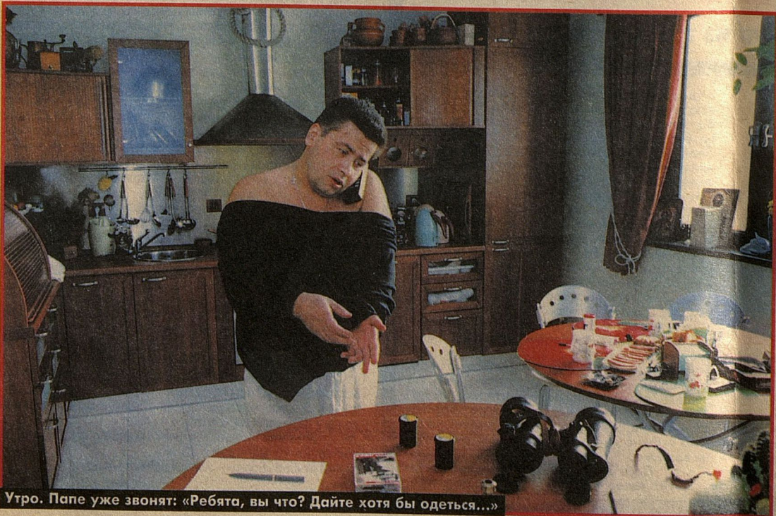
Утро. Папе уже звонят: «Ребята, вы что? Дайте хотя бы одеться...»