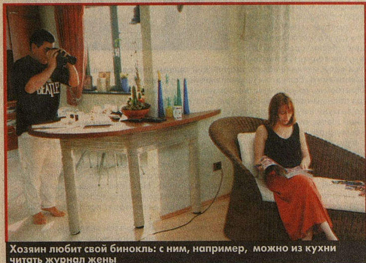
Хозяин любит свой бинокль: с ним, например, можно из кухни читать журнал жены