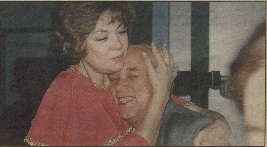
ОН И ОНА: люблю тебя, как ты меня