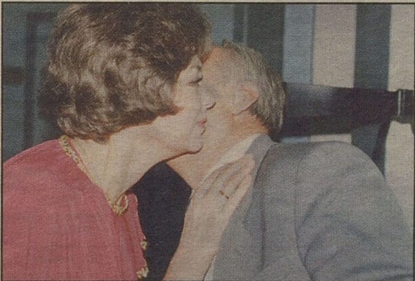
ОН И ОНА: люби меня, как я тебя

Беседу вели Валерий КРЫКОВ и Елена СУХОВА (фото)