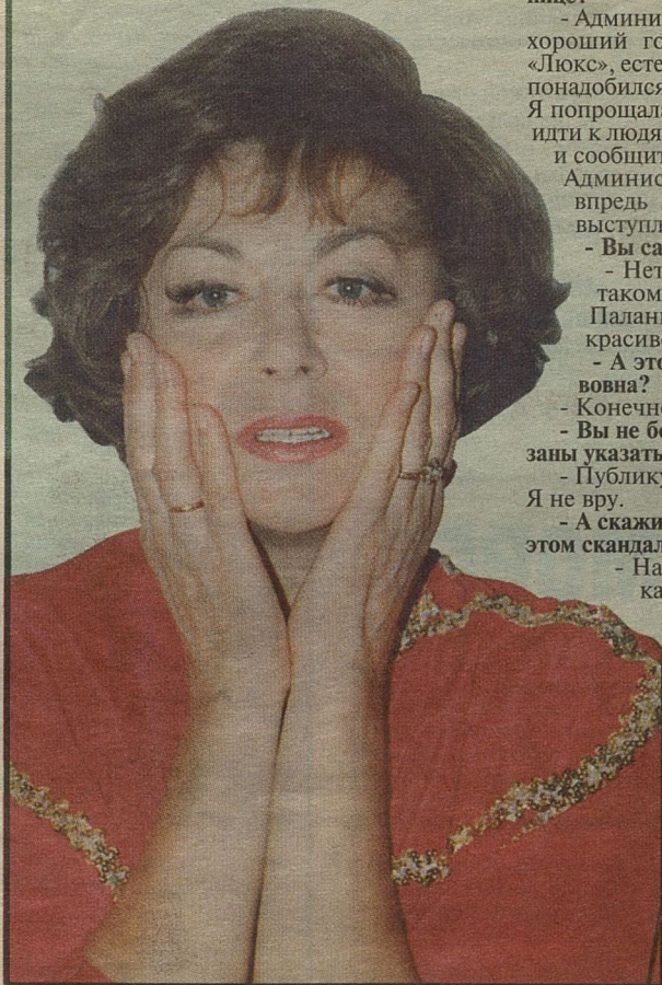
ЭДИТА ПЬЕХА: и это все о ней?!