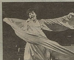
УЛЕТАЮЩАЯ ЗА ГОРИЗОНТ