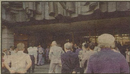
ТЕАТР В ВИЛЬНЮСЕ: зрители так и не дождались концерта Эдиты Пьехи

- И билеты продали? Публика-то собралась?