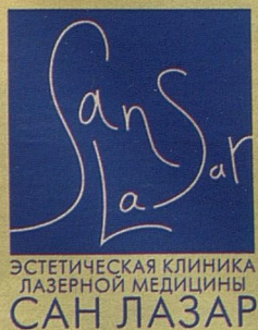
ФОТО ЛАЗЕРНАЯ ЭПИЛЯЦИЯ