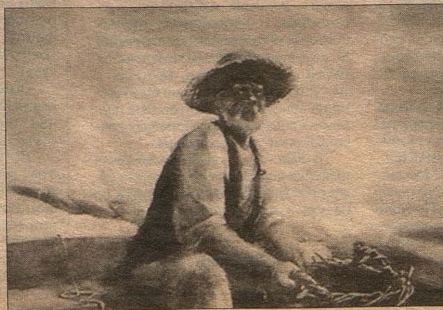
«Старик и море»

— У меня была мечта: соберу студию — человек 50. Приглашу из Москвы хороших аниматоров, режиссеров. Мастера будут читать лекции. Вырастут у нас 5 — 10 гениальных творцов. Ничего из маниловских мечтаний не вышло. Но фильм сам прирастает людьми. Сроки уносятся безжалостно — нужны руки. Провел я в художественном училище мастер-класс, человек 50 пришли. Работать осталась одна девочка. Потом привела подружку. Та — своего приятеля... В общем, все, как в фильме про льва Бо-