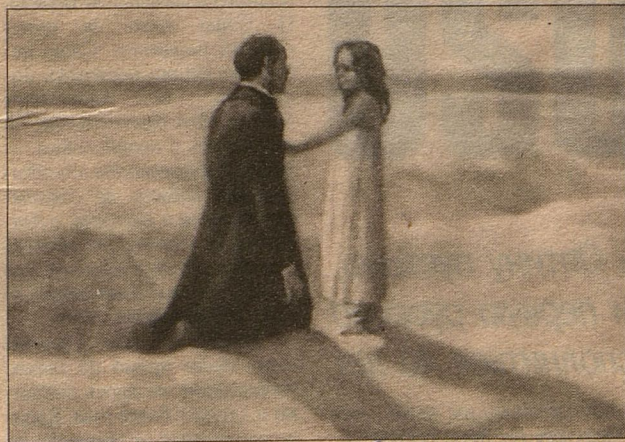
«Сон смешного человека»

— После «Оскара» «жизнь стало лучше, стало веселее»?