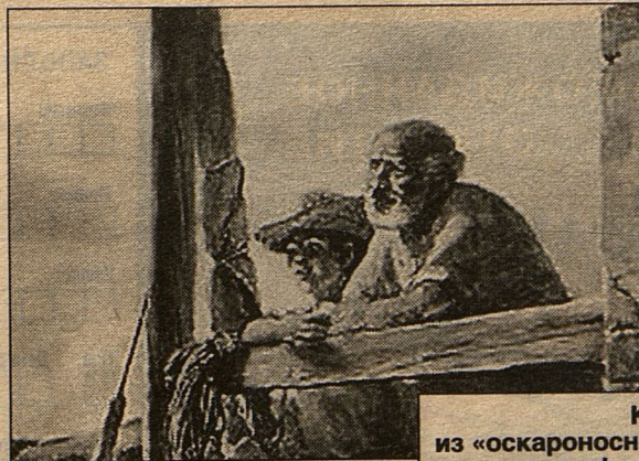
Кадр из «оскароносного» мультифильма «Старик и море».

но, бывает, и машу на все рукой. В Канаде это проще было сделать - сын подстраховывал. Я устанавливал кадр, объяснял ему, и он работал. Вообще я человек не дисциплинированный - по графику творить не могу.