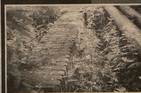
Здесь подельники спрятали обрез.