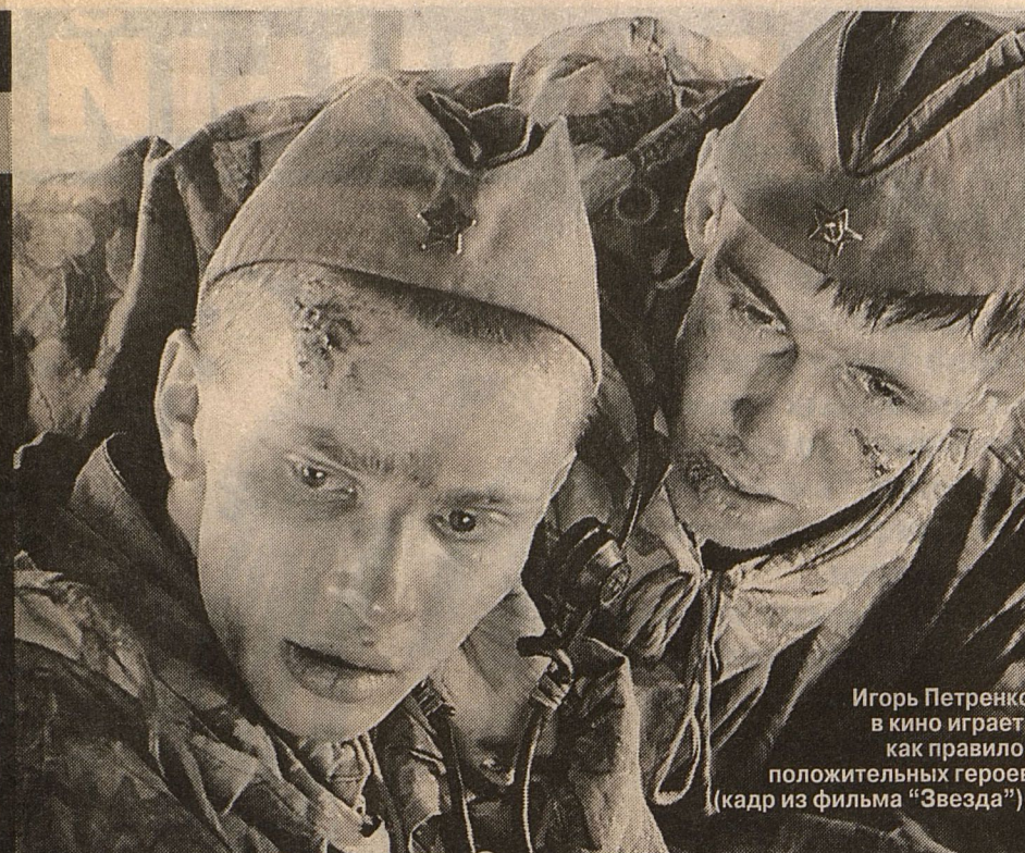
Игорь Петренко в кино играет, как правило, положительных героев (кадр из фильма "Звезда").

С 15 декабря 1992 года для этой семьи начался другой отсчет времени. Оно, это время, сочилось по капле — долгими ночами, когда родители не спали, сидя за столом и держась за руки.